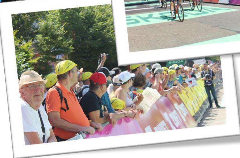
Arrivée le 15 août 2024