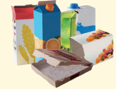
Emballages en carton et briques alimentaires